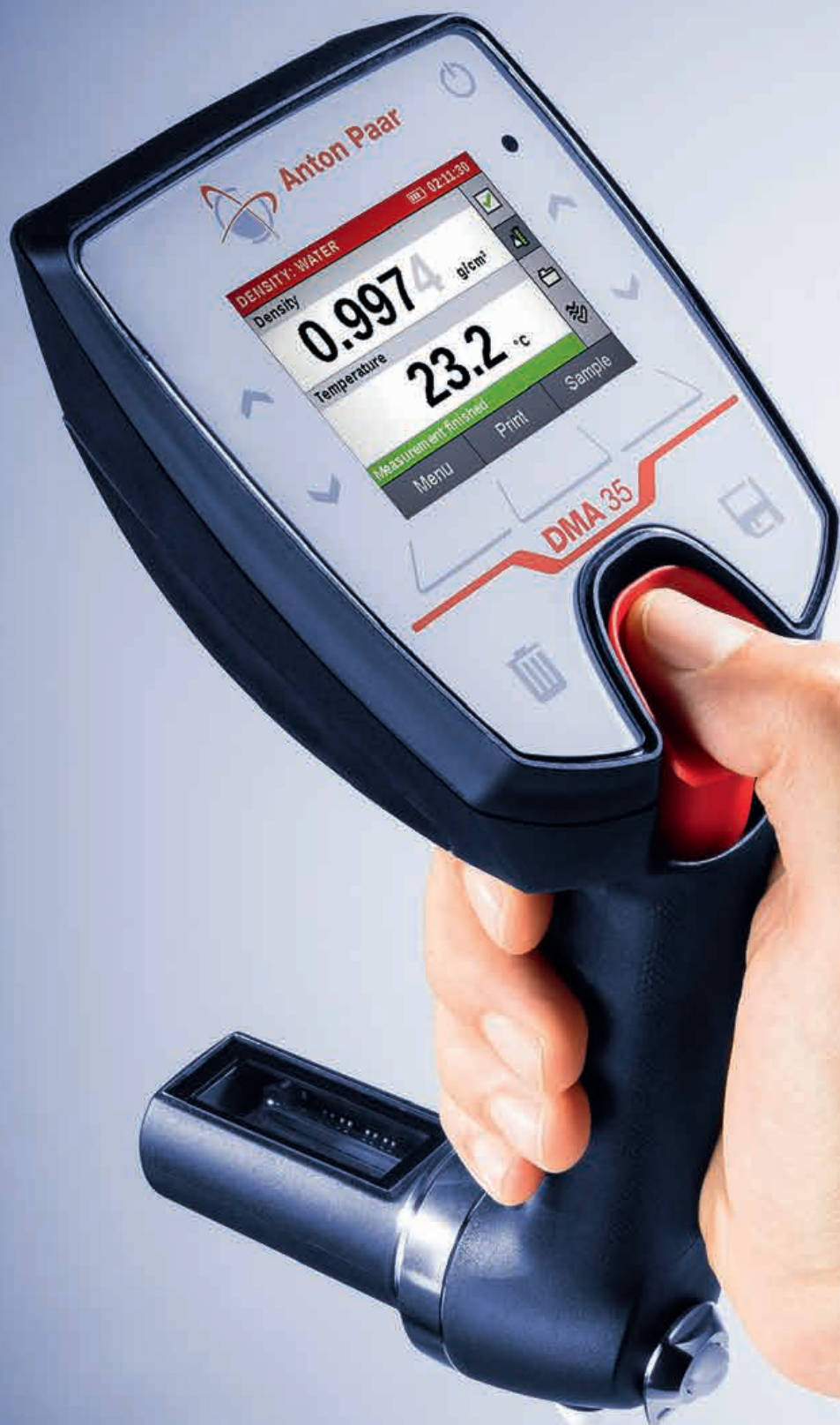
便携式密度浓度计